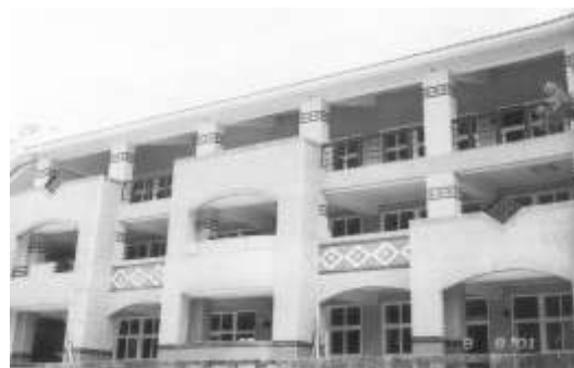
14.民視公司認養台中縣和平鄉和平國中。