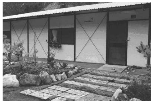
圖 8-14 台灣世界展望會興建組合屋。