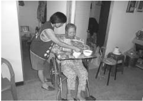
圖 8-9 東勢居家照顧。