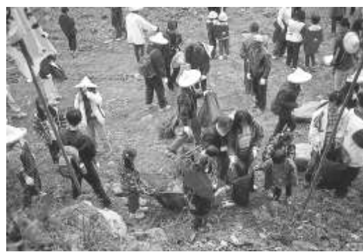
圖 8-19 南投縣埔里鎮桃米淨溪活動。