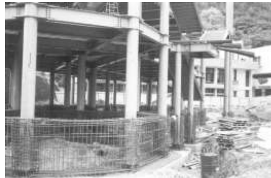
24.財團法人台灣明愛文教基金會認養苗栗縣泰安鄉梅園國小。