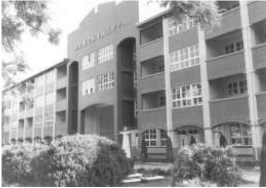
9.長榮集團認養南投縣水里鄉水里國中。