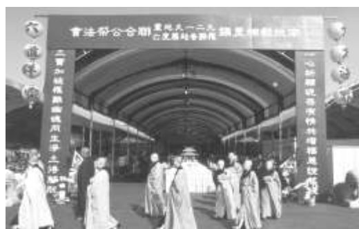
圖 8-8 南投縣埔里九二一大地震罹難者