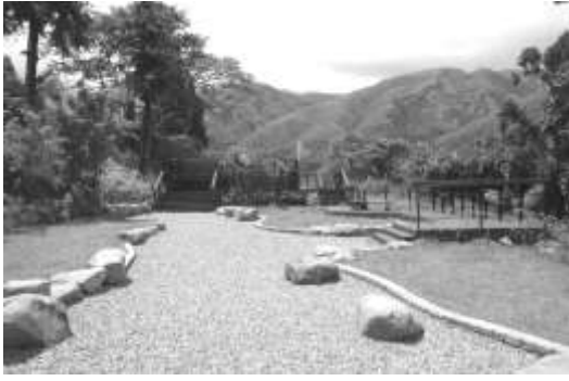
圖 8-27 南投縣鹿谷鄉內湖村崩崁頭觀景台。