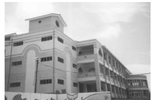
20.中國石油公司認養南投縣水里鄉水里國