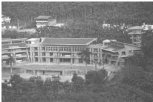
17.靈鷲山佛教基金會認養 南投縣國姓鄉育樂國小。