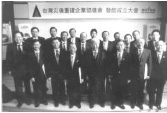
圖 8-1 台灣災後重建企業協進會成立大會。(88.10.21)