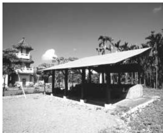
圖 8-22 台中縣石岡鄉土牛村(社區休閒公園)。