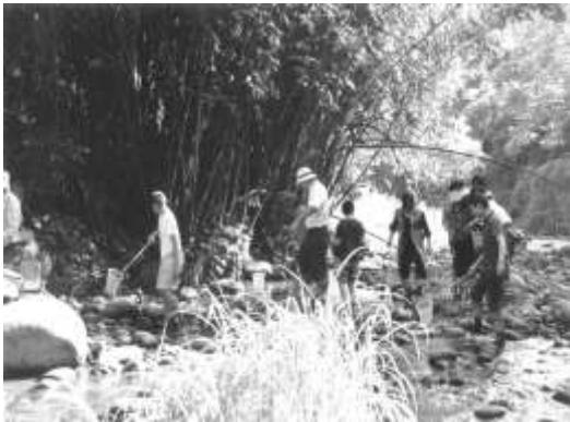
圖 8-35 白冷圳文化節系列活動 -食水料溪生態之旅。