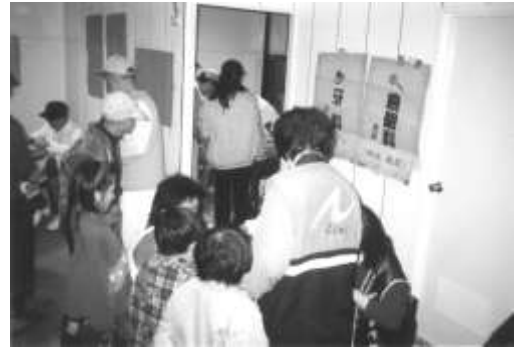
圖 8-10 石岡老人健診。 提供者：同前。