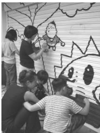
圖 8-20 婆婆媽媽社區圖書館。