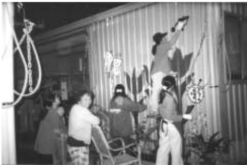
圖 8-11 南投彩繪組合屋。