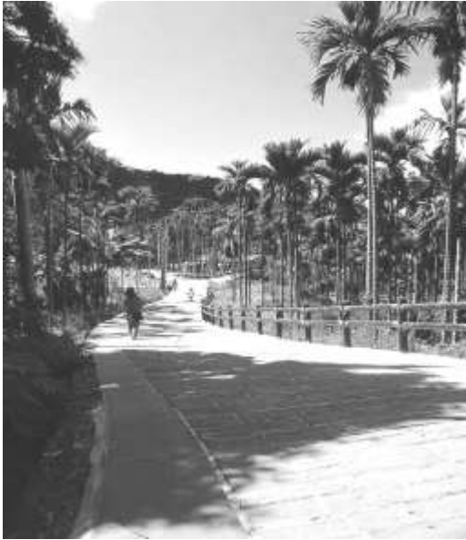
圖 8-33 雲林縣古坑鄉華山(步道)。 提供者：同前。