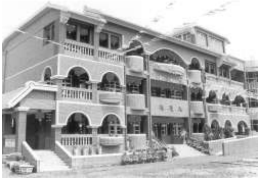
3.台塑關係企業認養雲林縣口湖鄉台興國小。