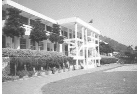
10.金車教育基金會認養南投縣 信義鄉新鄉國小。 提供者：同前。