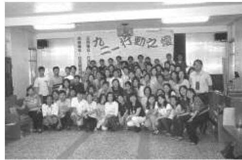
圖 8-12 福音 921 行動之愛。