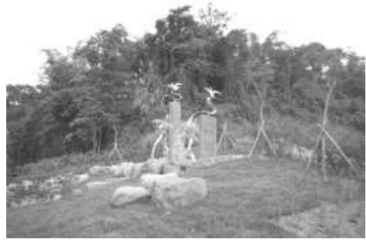
圖 8-28 雲林縣古坑鄉桂林村入口意象。