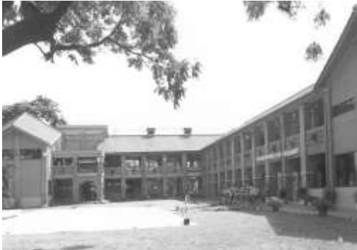
5.佛光山文教基金會認養台中縣東勢鎮中科國小。