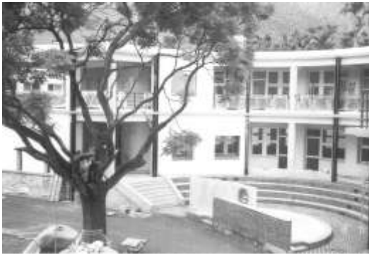
11.聯合報社、中廣、中視認養 台中縣和平鄉中坑國小。