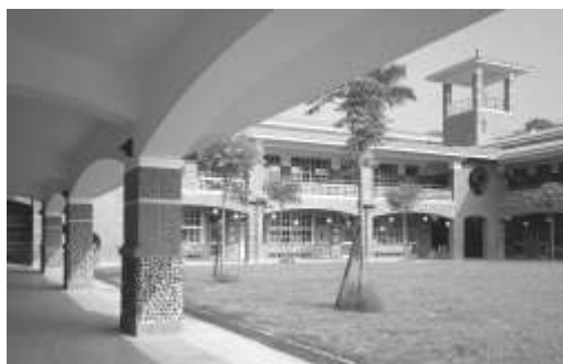
圖 8-17 民間團體認養重建學校照片集