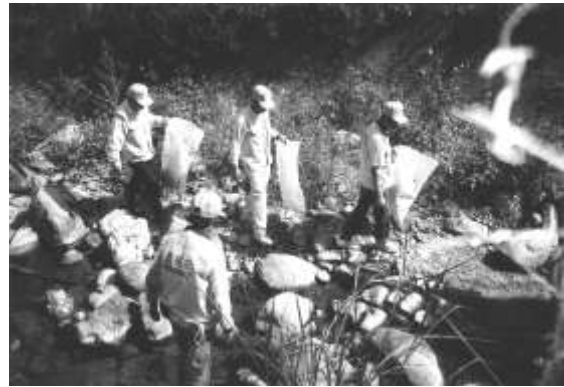
圖 8-36 淨溪中的生態保育巡守隊。