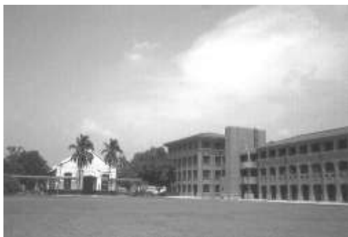
19.自由時報認養南投縣草屯鎮草屯國小。