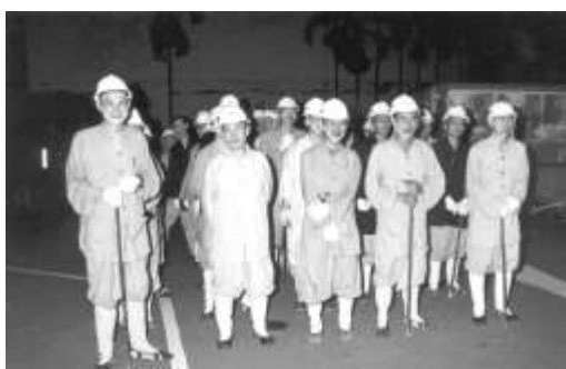
圖 8-7 中台禪寺動員僧俗二眾全力協助救災工作。

因此，災後中台禪寺各地之精舍，辦理各級禪修課程，引導民眾從事「定心」、「靜心」與「明心」的心靈境地外，並開辦各類課程，如兒童讀經班、兒童說故事比賽、繪圖書畫比賽、插花研習班、親子禪修班等，藉由多元化的方式，引導民眾走出震災陰霾，並將佛法植入人心，落實「佛法生活化」與「佛法教育化」的精神。