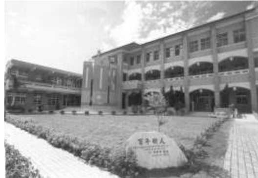
6.台灣省國際獅子會認養南投縣水里鄉玉峰國小。