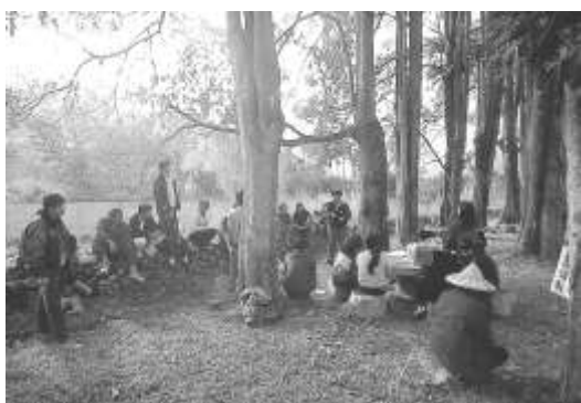
圖 8-18 南投縣埔里鎮桃米居民會議。

埔里鎮桃米社區經由民眾之參與，以自然生態與農業景觀，打造觀光休閒村。社區民眾共同進行產業、社區生活環境、社區特色形象與生態環境的營造與重建。其豐富之生態景觀，已成為埔里地區重要的休閒旅遊景點。