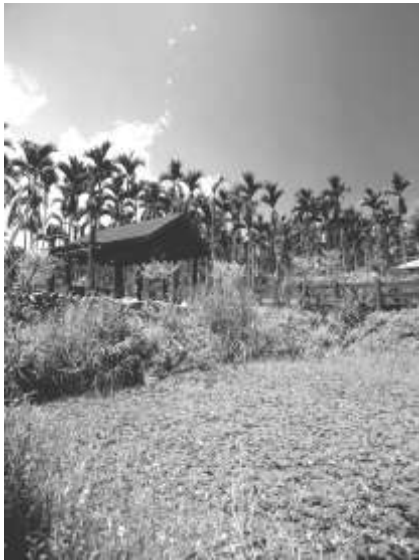
圖 8-29 南投鹿谷鄉內湖村(景觀生態池)。