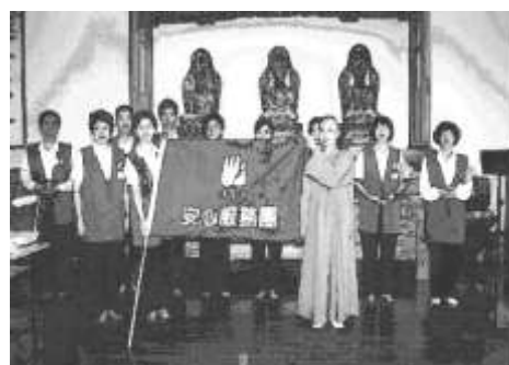
圖 8-6 法鼓山安心服務團成立授旗。