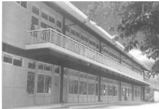
23.台北市扶輪社 3480 區認養南投縣名間鄉名間國中。