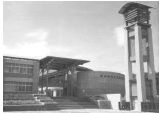
12.中時報系認養南投縣魚池鄉 魚池國小。