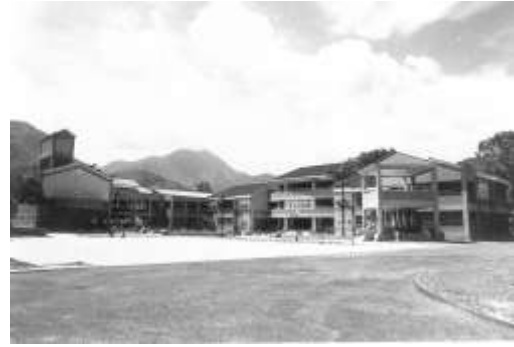
4.TVBS 關懷台灣文教基金會認養南投縣鹿谷鄉瑞峰國中。