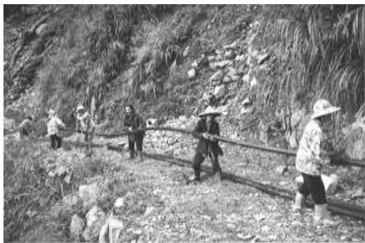
圖 8-13 台灣世界展望會協助 興建簡易水工程。

鄉與信義鄉與台中縣和平鄉等地，動員 300 多位牙醫師進入山區位老人裝置假牙、重建上下顎咬合關係，重建口腔咀嚼功能，讓老人恢復正常飲食功能。 (三)規劃老人旅遊專案，以調劑老人生活，協助其走出震災的心理創傷。 92