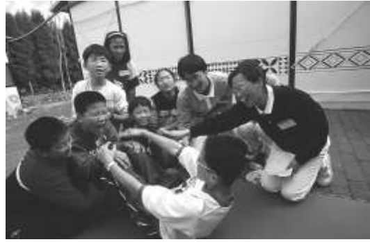
圖 8-4 九二一災後關懷，慈濟青年寒假安心關懷活動。