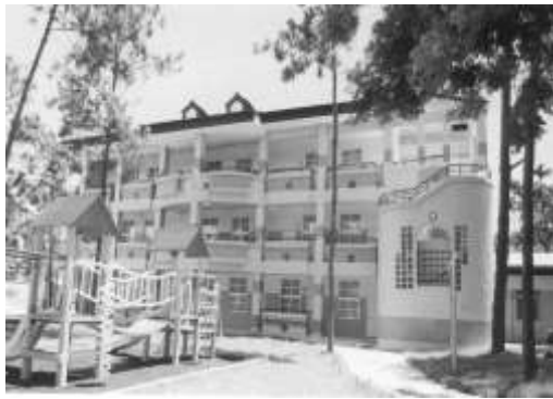
15.中華開發工業銀行認養 苗栗縣卓蘭鎮內灣國小。