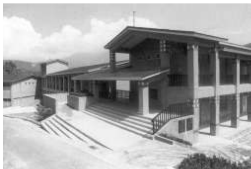
13.富邦慈善基金會認養 南投縣信義鄉人和國小。