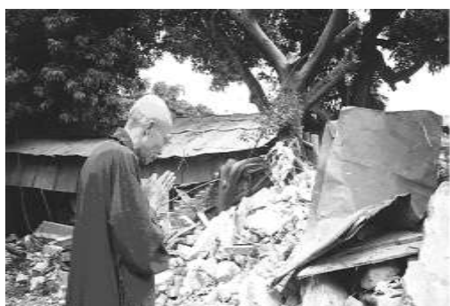
圖 8-5 聖嚴法師巡視災區。

可知安心服務站在併入法鼓山社會福利慈善事業基金會之後，其服務的面向更加廣泛，除秉持法鼓山以精神為主，物質為輔之救助原則，推動心靈環保外，並持續家庭慰訪，辦理端午、中秋與歲末關懷活動，配合行政院青年輔導委員會寒假返鄉工讀服務，推動校園心靈環保列車，舉行年度祈福法會，救助桃芝颱風災民，自 91 年 9 月起百年樹人獎學金對象擴大為社會清寒弱勢子弟等。使安心服務站關懷的對象由災民擴大為所有的社區民眾，由心靈重建擴大為整體身心家庭的關照，並結合社會工作、心理輔導、醫院志工等專業領域的志工，為民眾提供更廣泛、專業與長期的關懷與協助，成為長久陪伴社區的在地團體。