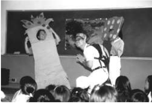
圖 8-3 臺中縣新社鄉新社國小「震動大愛」