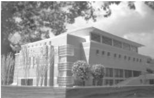
7.台灣省台中農田水利會認養台中市北屯區軍功國小。