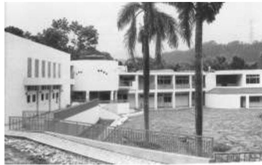
8.一貫道中一堂、基礎道德、天惠道德文教基金會認養南投縣中寮鄉廣福國小。