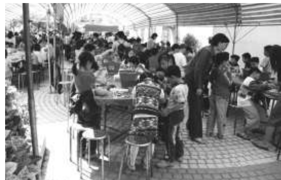
圖 8-38 中陽公園彩繪石頭活動參與盛況。