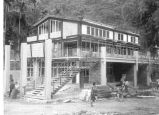
22.財團法人浩然基金會認養南投縣信義鄉潭南國小。