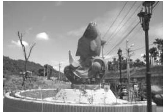
圖 8-32 南投縣鹿谷鄉清水村入口意象。 提供者：同前。