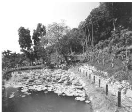
圖 8-21 南投縣魚池鄉大雁村生態工法。 提供者：行政院九二一震災災後重建推動 委員會。