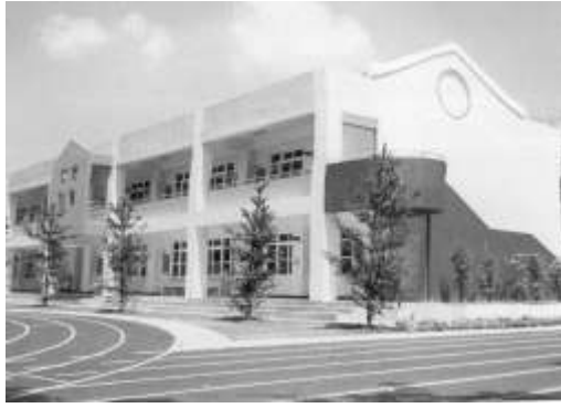
21.遠東關係企業認養南投縣南投市新豐國小。