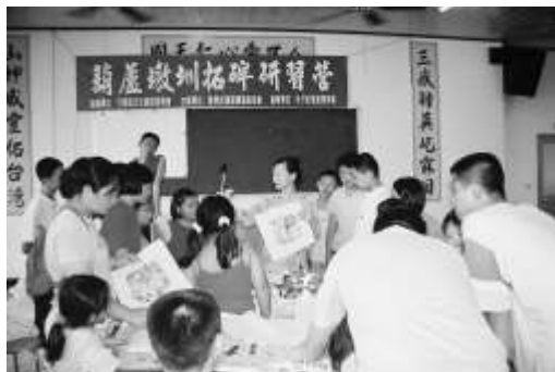
圖 8-37 朴子社區拓碑研習營。