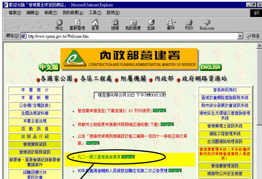
圖二 「九二一震災重建建築巢專案網頁」之網頁位址圖