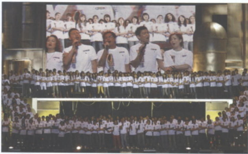
◎每次發生重大災害，演藝人員常常會挺身而出帶頭捐款。