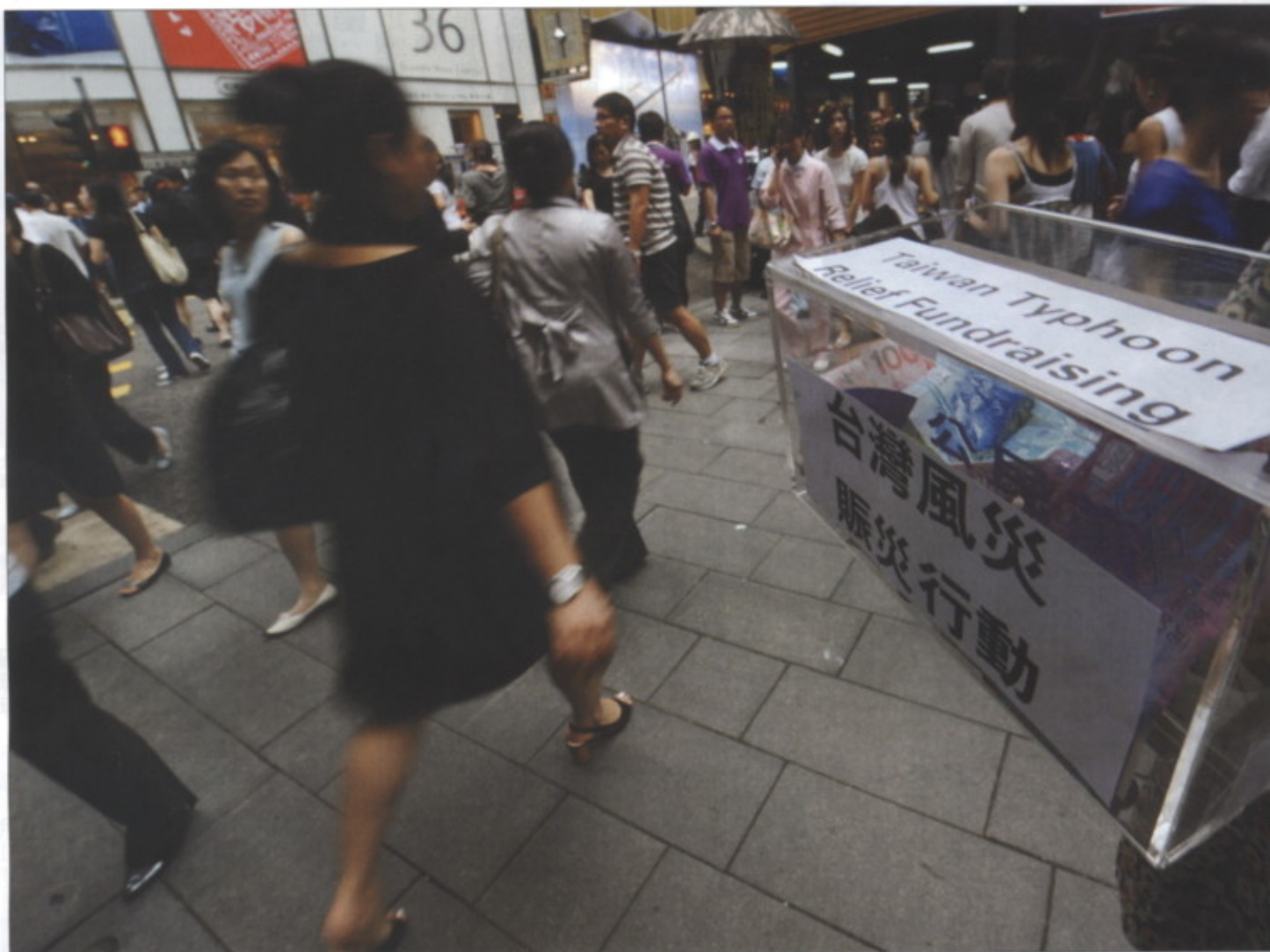
◎莫拉克颱風重創南台灣，社會各界紛紛發揮愛心，捐出金錢與物資。

會計師的查核機制，又迴避了政府部門較嚴苛的撥款流程與稽核制度，比較具有效率與彈性。 至於針對災後政府經費的撥款，或民間捐款的使用與效率，謝志誠認為現在不是很必要訂定什麼特別的稽核與保證制度，因為這些制度是靠承平時所建立起來的，災害發生後，希望大家捐款、感謝各慈善團體都來不及了，不宜此時再談這些問題。