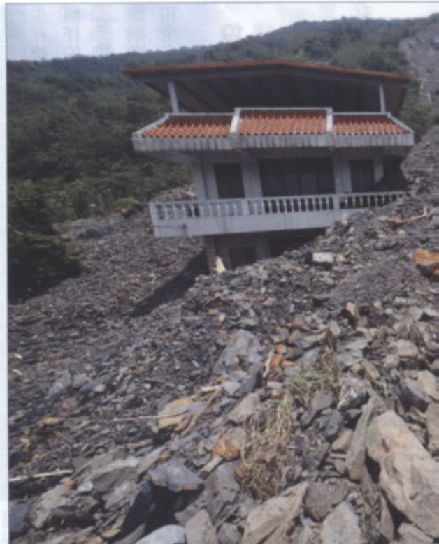
◎預計八八水災後的重建工作將是一條漫長的道路。

921基金會歷經九年後解散清算，現金餘額與不動產，約45億3000萬元，依章程規定移交給營建署「財團法人賑災基金會」，加上賑災基金會原有的十億元基金，總計有近五十六億元民間款項，可及時運用投入各項救災工作中，讓921民間愛心得以持續發光發熱。（文◎沈婉玉）