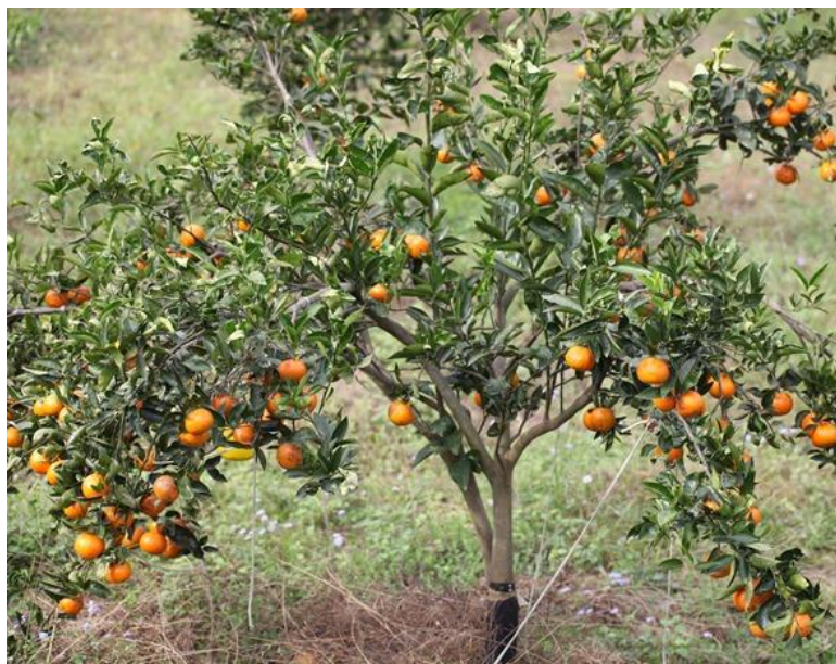
福利蒙柑