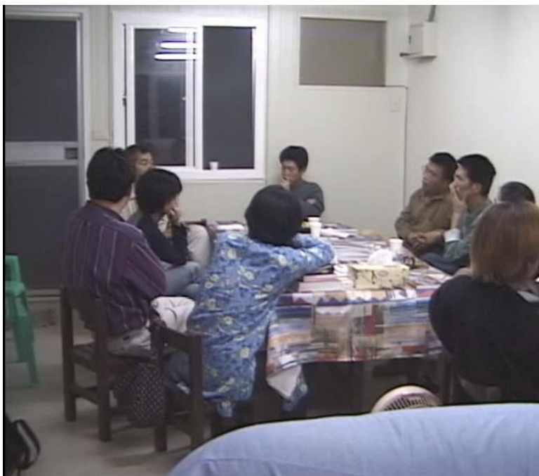
籌備成立鄉親寮工作站