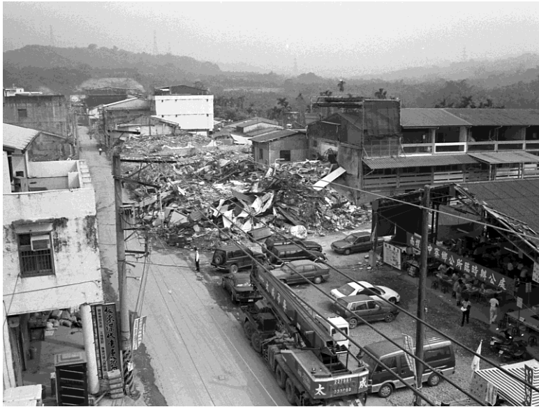
震後中寮永平老街和中寮鄉臨時辦公室

中寮鄉依山勢及流域可分為北中寮與南中寮兩大區塊，鄉民叫北中寮為「龍眼林」，南中寮為「鄉親寮」。921之前，原本無風無雨的公務員生活：上班時，到社區活動中心幫幫年老村民申請老人年金，辦農、健保，發放兵役通知，有時幫不識字的村民寫寫信、過濾稅單等